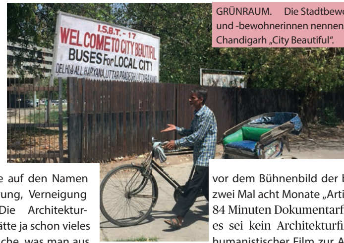
GRÜNRAUM. Die Stadtbewohner und -bewohnerinnen nennen Chandigarh „City Beautiful“.