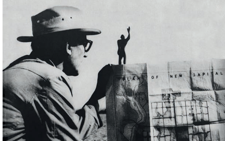
ARCHITEKTURIKONE. Verehrt, kritisiert, bewundert, umstritten: der Schweizer Visionär Le Corbusier.